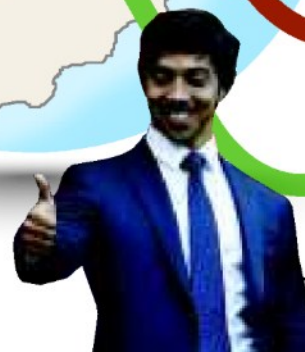
Mansour Bin Zayed Al-Nahyan (Abu Dhabi): proprietario del Manchester City