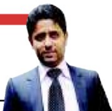
Nasser Al-Khelaifi (Qatar): nuovo azionista di maggioranza del PSG

Al Jazeera ha acquisito i diritti televisivi del campionato francese di calcio in Francia