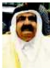
Hamad Ben Khalifa Al-Thani (Qatar): il creatore di Al-Jazeera ha fondato il Tour del Qatar